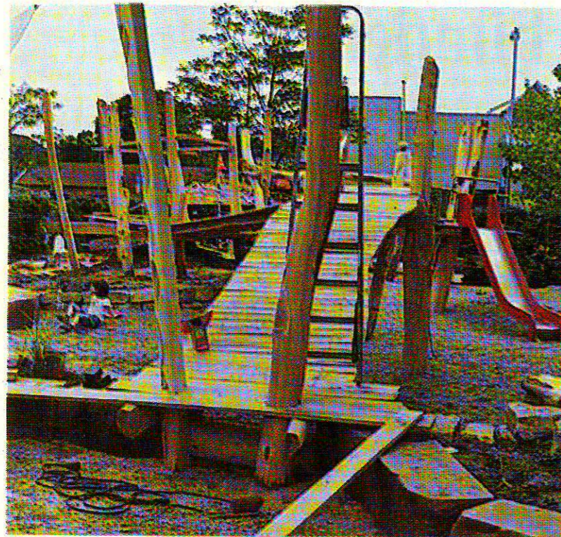
Viel Holz dominiert den neuen Spielplatz der Französischen Schule in der Saarbrücker Halbergstraße.

Regionalverband und Land unterstützen Bauprojekt der Französischen Schule